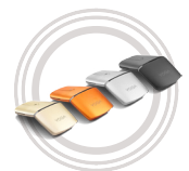
Souris Lenovo Yoga™