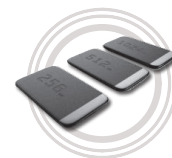
Lenovo USB-C SSD