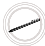
Stylet actif Lenovo Active Pen 2